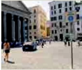
L'area del Pantheon

Dopo la chiusura dei Fori, le isole pedonali si allargheranno a macchia di leopardo. Da piazza Perin del Vaga, al Flaminio, al borgo di Cesano passando per Ostia. Sono alcune delle zone che potrebbero essere chiuse al traffico. I municipi stanno preparando l'elenco delle strade in cui sarà proibito l'accesso ai veicoli.